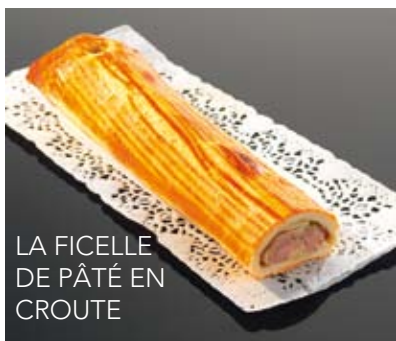
LA FICELLE DE PÂTÉ EN CROÛTE

La ½ ficelle foie gras tranchée sur assiette ..... 26.80€