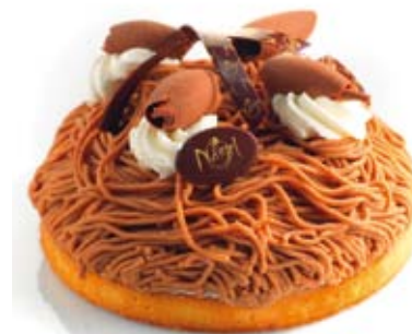
LA TORCHE AUX MARRONS

Egalement disponible le 31 /12 en 4 et 6 pers.