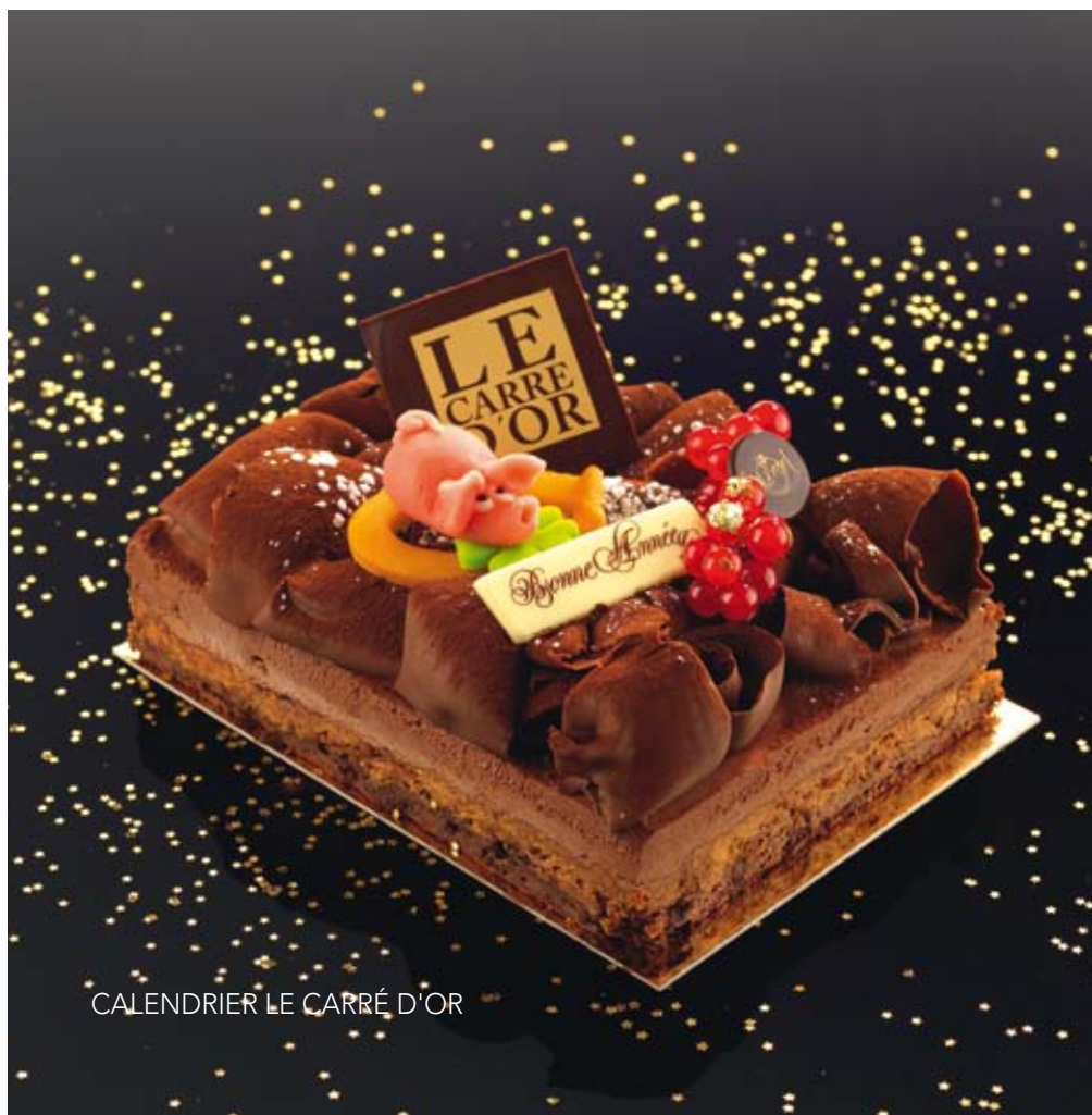
CALENDRIER LE CARRÉ D'OR