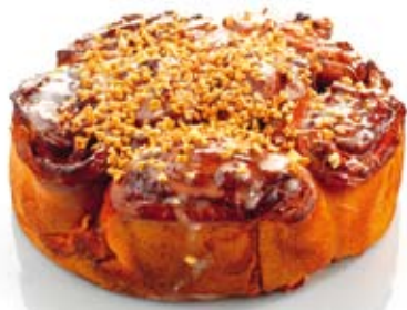
LE CHINOIS AUX AMANDES