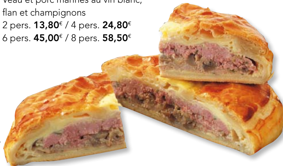
LA TOURTE "NAEGEL"