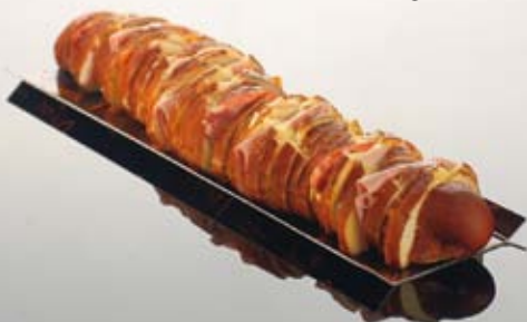
LE PAIN SILZER